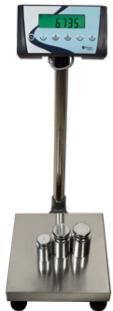
Codo adaptador para columna