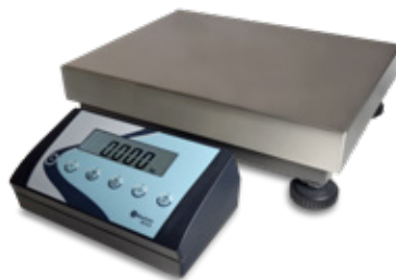
Adaptador soporte bajo