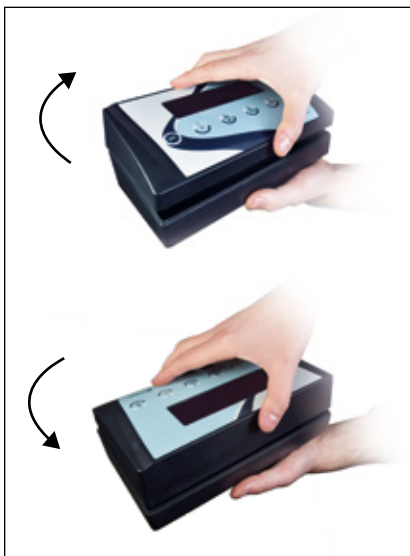
Flip-Flop 180° (Caja reversible)