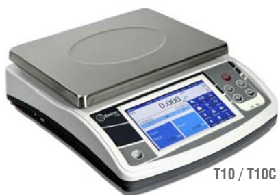
T10 / T10C